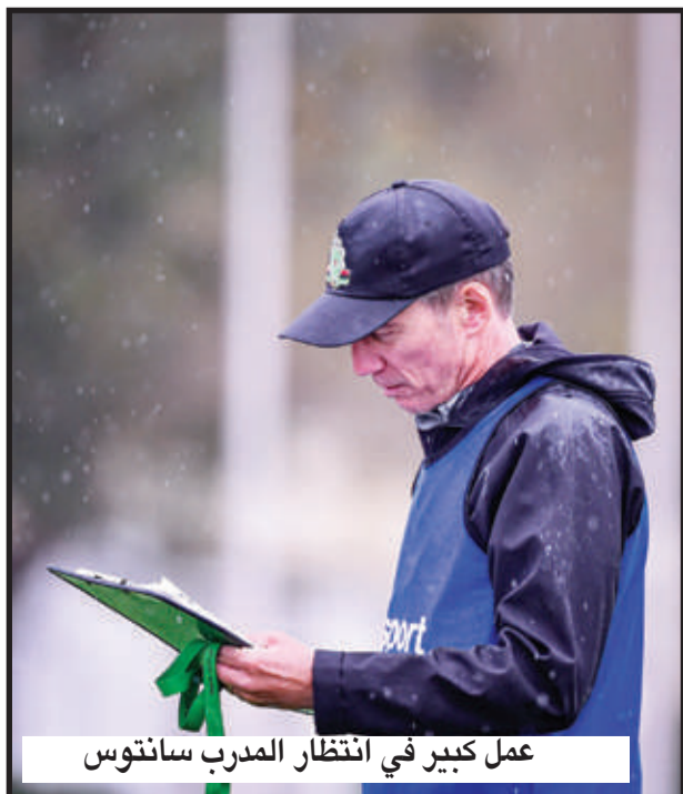
عمل كبير في انتظار المدرب سانتوس

مجموعته على استعادة التوازن والظهور بصورة أقوى خلال لقاء العودة.