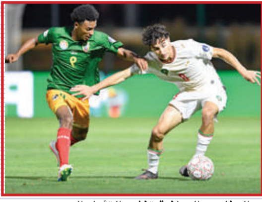
العناصر الوطنية تشند التأهل المزدوج

داء اللاعبين مع توالي المباريات، سواء على مستوى الفهم التكتيكي أو اكتساب مزيد من الثقة داخل الملعب، بما يعزز قدرتهم على التعامل مع مختلف السيناريوهات خلال البطولة. وبعيدا عن سباق الصدارة، يراهن المنتخب المغربي أيضا على انتزاع بطاقة التأهل إلى نهائيات كأس العالم للعبة ذاتها، المقررة في قطر خلال نهاية السنة الجارية، حيث يطمح الأشبال إلى تجاوز محطة ربع النهائي التي شكلت في السابق أعلى سقف للإنجاز في هذا المحفل العالمي.